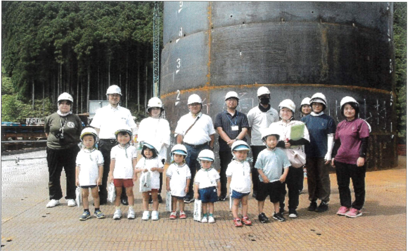
奥瀬道路見学会（7月14日・1号橋）