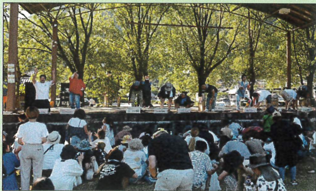
おくとろ公園でビアガーデンが、開催されました。(餅まきの様子)